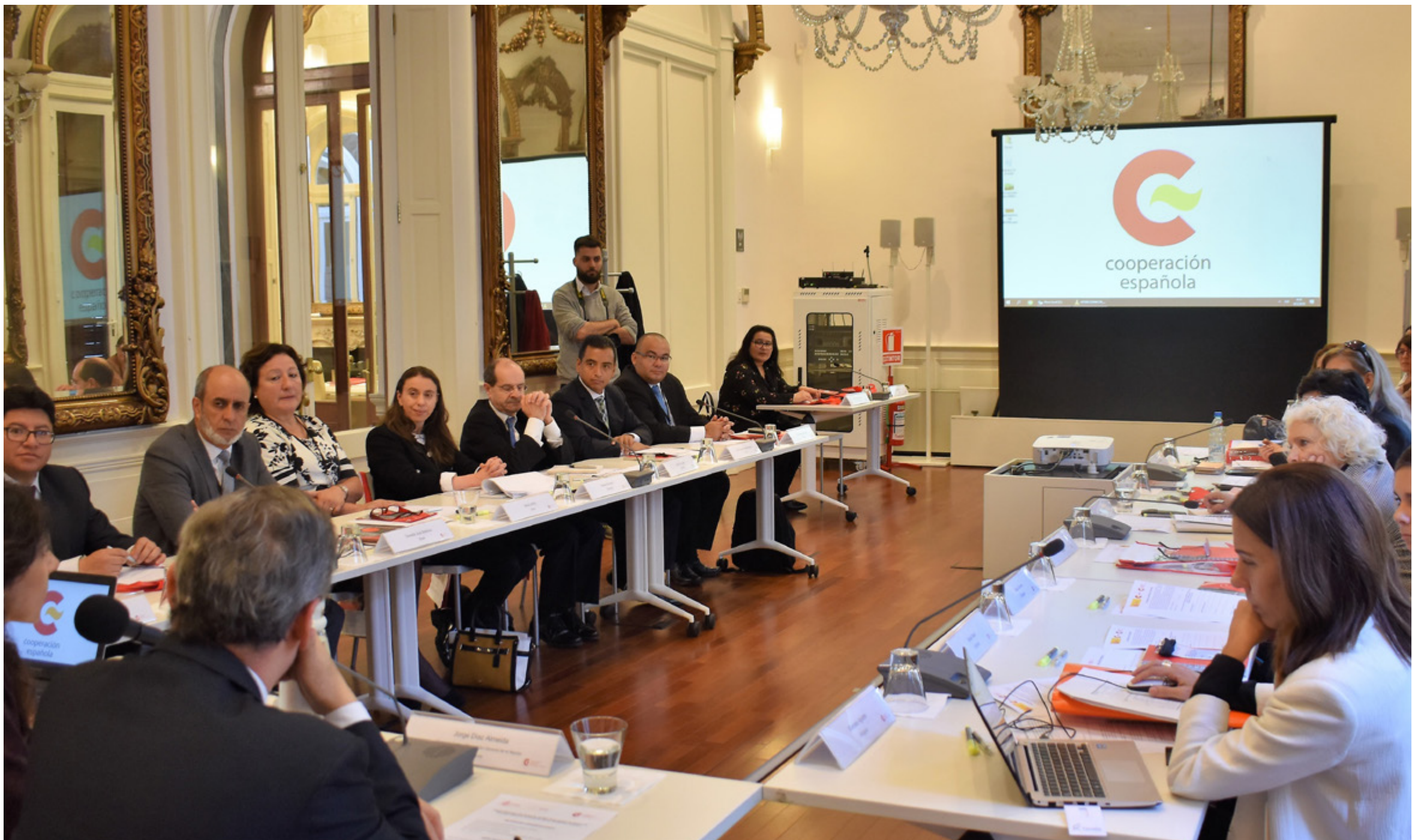
Representantes de 14 Ministerios Públicos participaron en la elaboración de la Carta de Principios Éticos de la AIAMP, la que busca dotar a los fiscales de una guía que oriente su actuación desde una perspectiva transversal de Derechos Humanos y de género.

Y añade que las conclusiones a las que llegaron reforzaron que se necesitaba un marco sobre el que actuar, “porque en el último tiempo ha existido cierto deterioro en la confianza en los sistemas de justicia”.